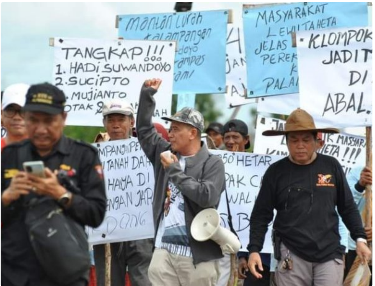
Gambar: Aksi Unjuk Rasa Masyarakat Kelompok Tani

PALANGKA RAYA - Sengketa kepemilikan tanah yang terjadi di Kota Palangka Raya selama ini, cukup meresahkan. Hal ini tentunya bisa mempengaruhi geliat pembangunan di ibukota provinsi Kalimantan Tengah (Kalteng) kedepannya.